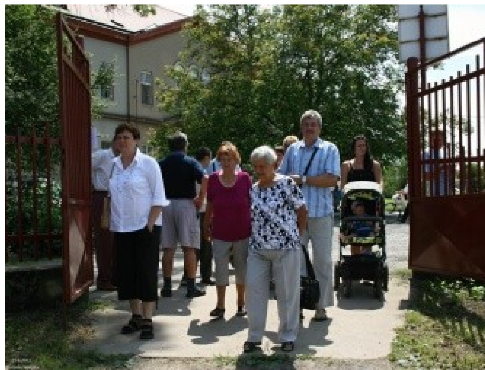
Setkání rodáků 23.6. 2012

VYDÁVÁ OBECNÍ ÚŘAD VÍCEMĚŘICE ČTVRTLETNÍK ROČNÍK 2012, číslo 2