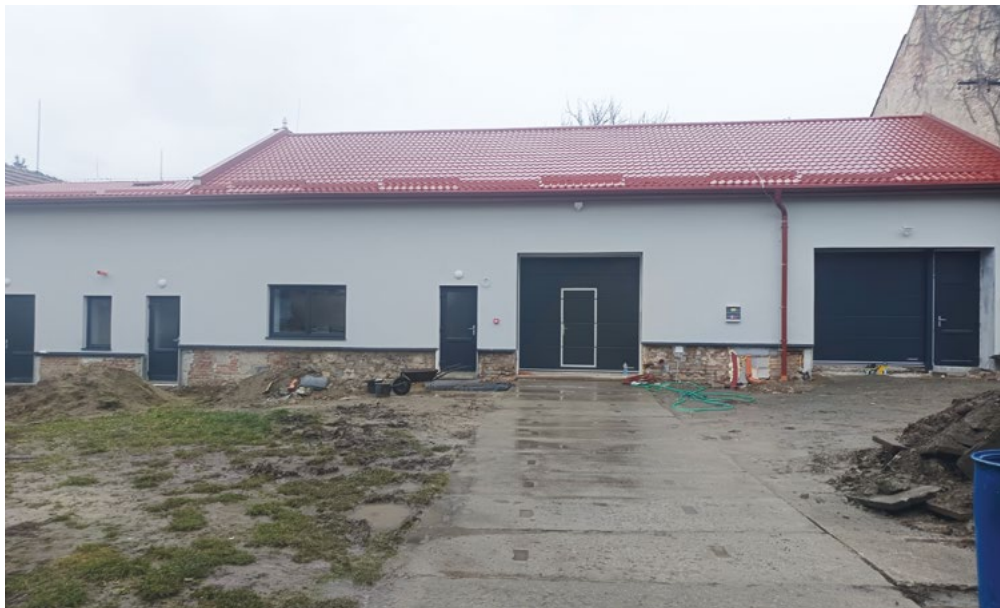
Areál č.p. 83