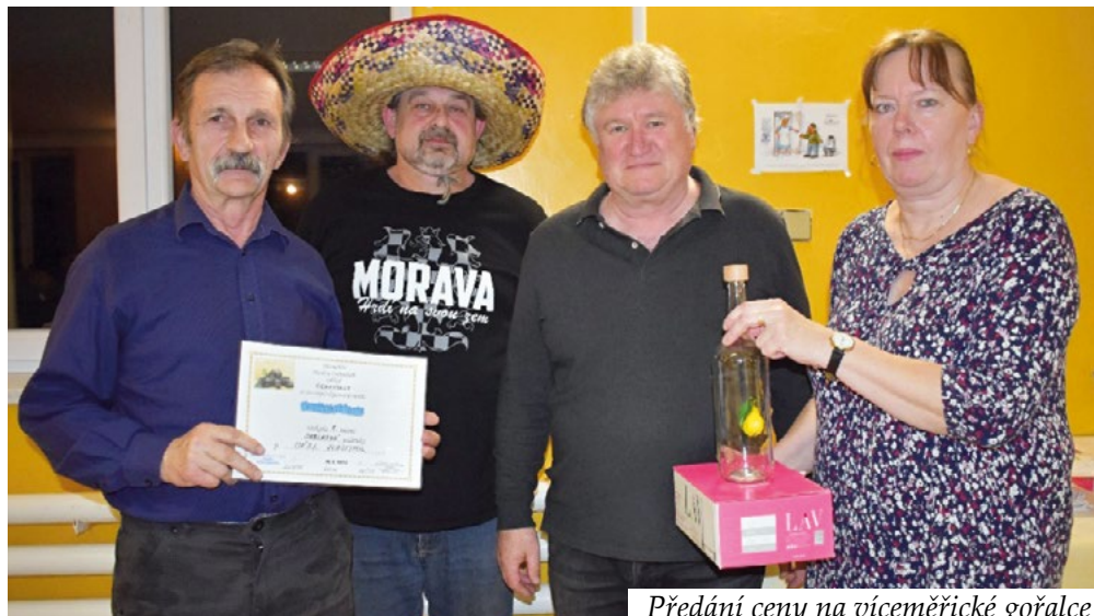
Předání ceny na víceměřické gořalce