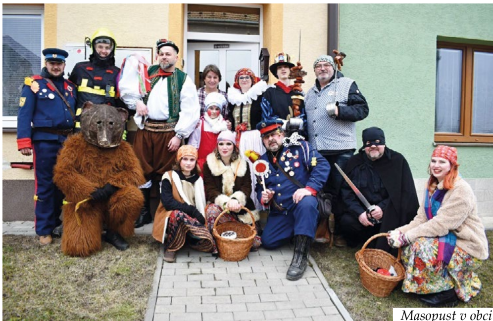
Masopust v obci