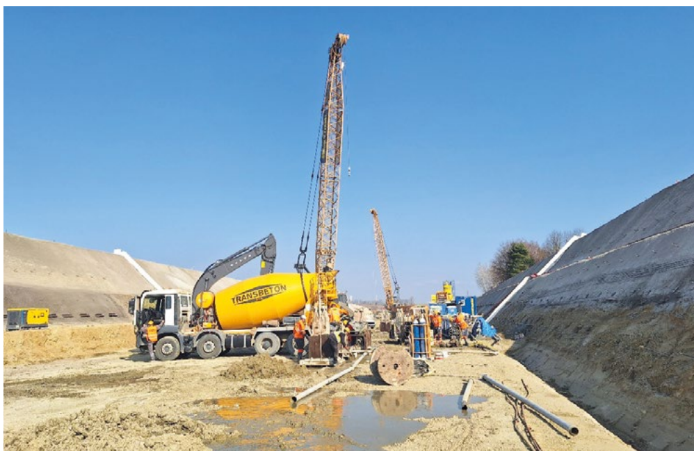
Budování tunelu mezi Víceměřicemi a Němčicemi