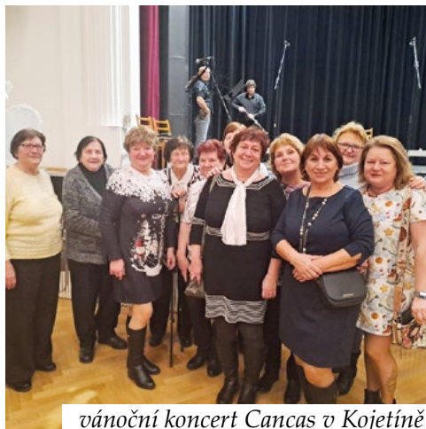
vánoční koncert Cantas v Kojetíně