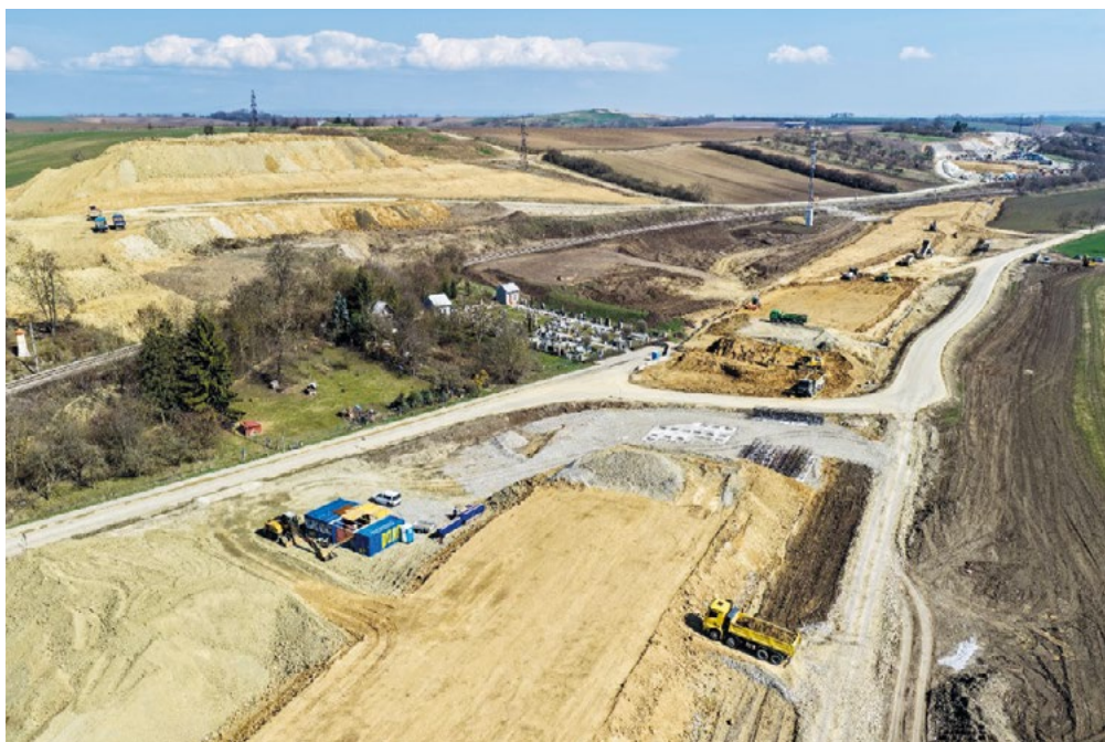
Pohled na trať u hřbitova