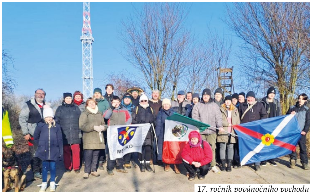
17. ročník povánočního pochodu