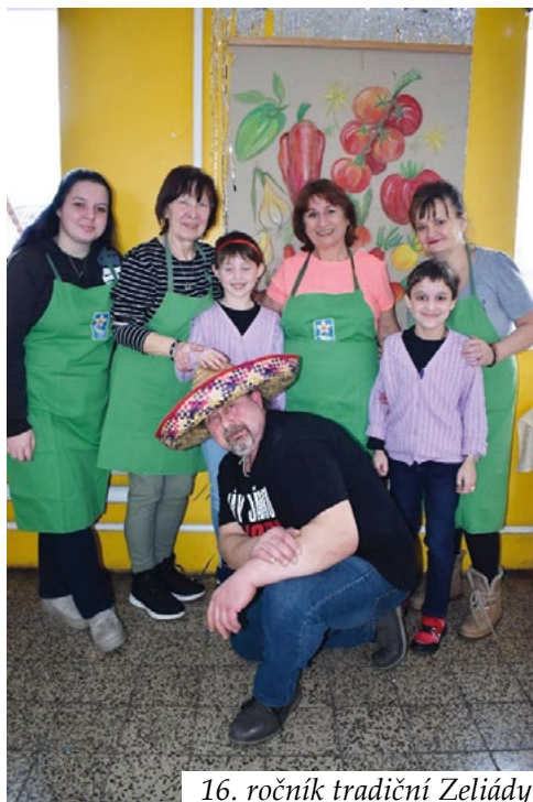
16. ročník tradiční Zeliády