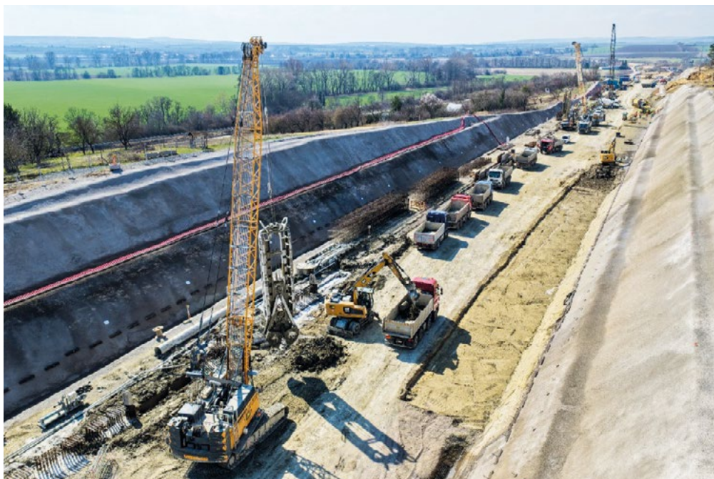
Budování tunelu mezi Víceměřicemi a Němčicemi