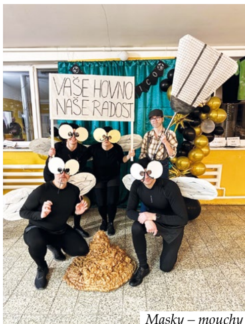
Masky – mouchy