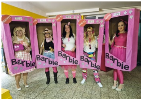
Masky – Barbie, které získaly 1. místo

Následovala další tradiční akce „Maškarní ples Mexico“, který se konal dne 27. 2. 2026 v kulturním sále „Košikárna“ ve Víceměřicích. O hudbu se postaralo tradičně duo HIT MAKERS se zpěvačkou Danielou z Dřevnovic. Účast splnila naše očekávání a máme obrovskou radost z rekordního počtu masek (62). I když se opakují, musím ocenit fantazii a nápaditost vlastnoručně vyrobených masek a také odvalu těch, kteří to v nich vydrželi, protože to nebylo vůbec jednoduché. Objektivní (nezaujatá) porota vybrala