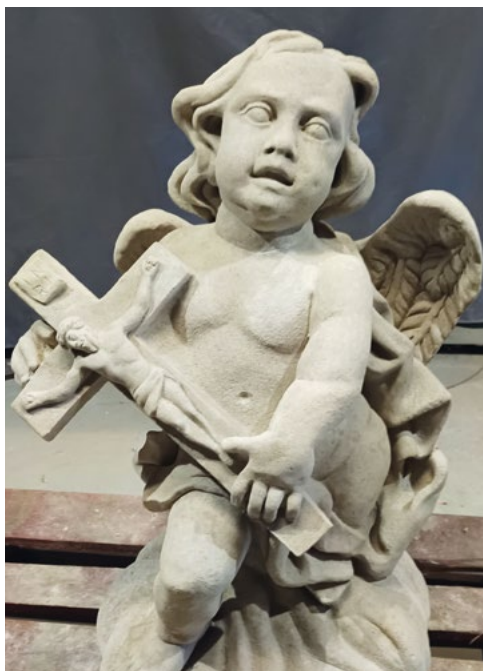
Socha sv. Jana Nepomuckého