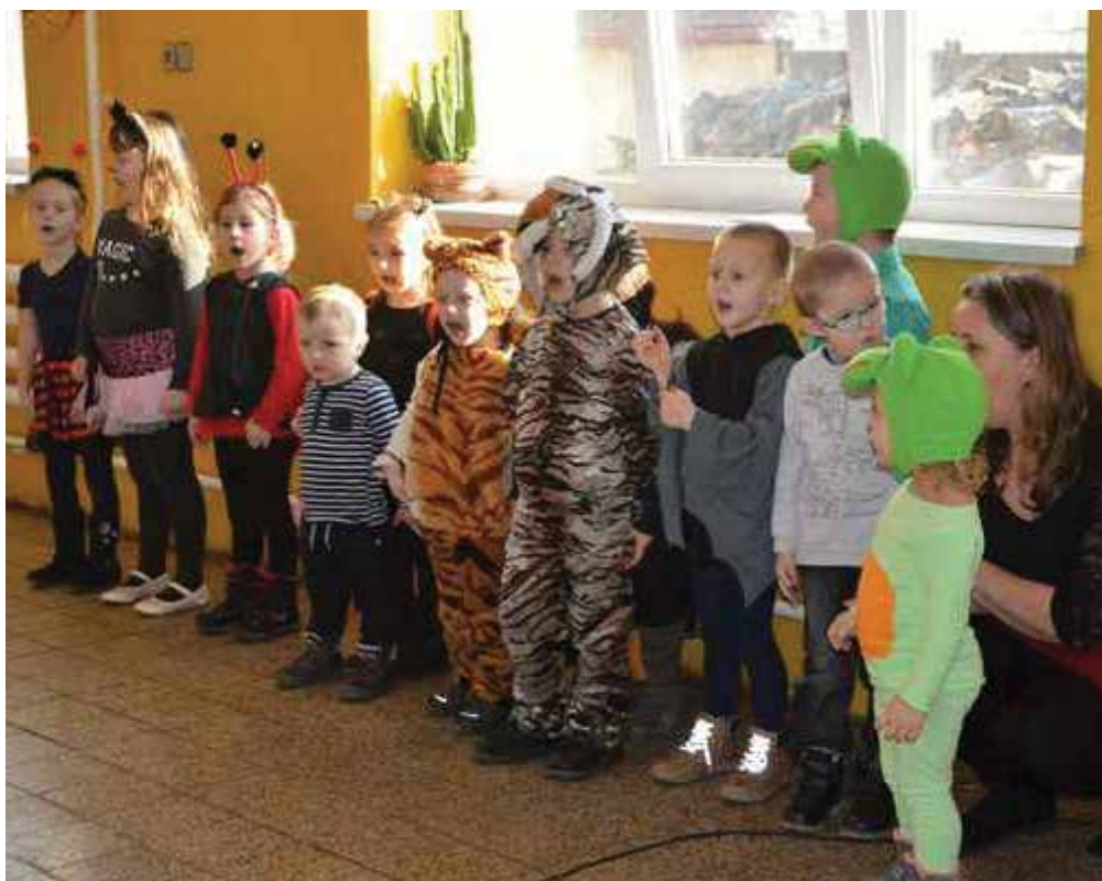
Vystoupení dětí na setkání seniorů