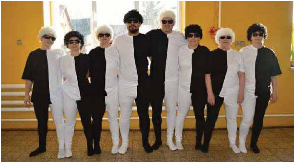
Vystoupení "Black and white"