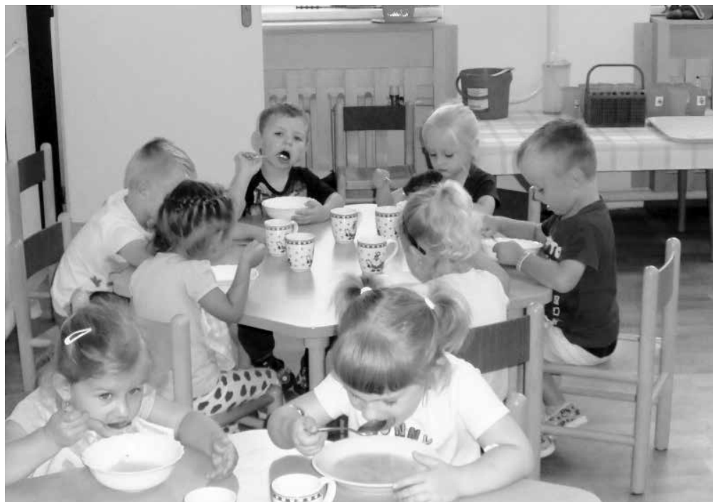
Děti v mateřské škole

Vystihuje širokou škálu oblastí, o kterých si s dětmi povídáme, při prohlížení knih nebo, co se děti doví doma, nebo v televizi. Je zaměřený na problematiku empatie, komunikace a ekologie, což jsme se snažily názorně přiblížit v podtextu názvu našeho ŠVP. Celý ŠVP zahrnuje téměř všechny oblasti a nabízí taková témata, která seznamují děti s realitou v rovině odpovídající jejich možnostem. Důležitým faktorem při sestavování programu je