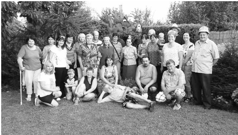
Účastníci prohlídky zahrádek

prikami a záhon s rajčaty, které jsou zálibou p. Míka staršího. Vždy mne zde zaujme způsob pěstování rajčat našikmo. Tři rostliny u hůlek spolu tvoří jehlan a asi tento způsob má něco do sebe, jelikož jsou vždy rostliny obtěžkány obrovským množstvím plodů. Dále je už zahrada víceméně odpočinková a okrasná. Posečený trávník, mladé plodící stromy, záhon ma-